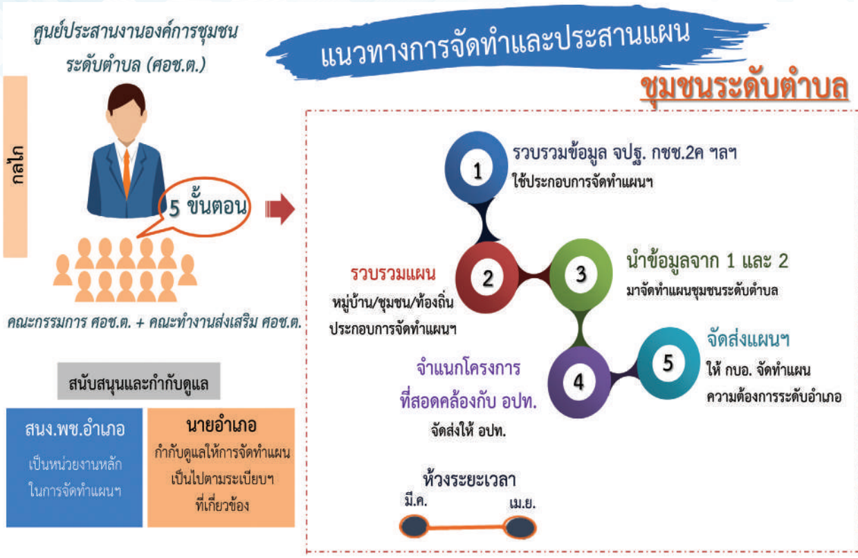
แผนภาพที่ 6 ขั้นตอนการจัดทำและประสานแผนชุมชนระดับตำบล (แผนพัฒนาตำบล)

การจัดทำและประสานแผนชุมชนระดับตำบล (แผนพัฒนาตำบล) ให้ดำเนินการในห้วงเวลาระหว่างเดือน มีนาคม - เมษายน โดยมีศูนย์ประสานงานองค์การชุมชนระดับตำบล (ศอช.ต.) เป็นกลไกหลักในการจัดทำและประสานแผนชุมชนระดับตำบล ซึ่งมีขั้นตอนในการจัดทำแผนฯ ดังนี้