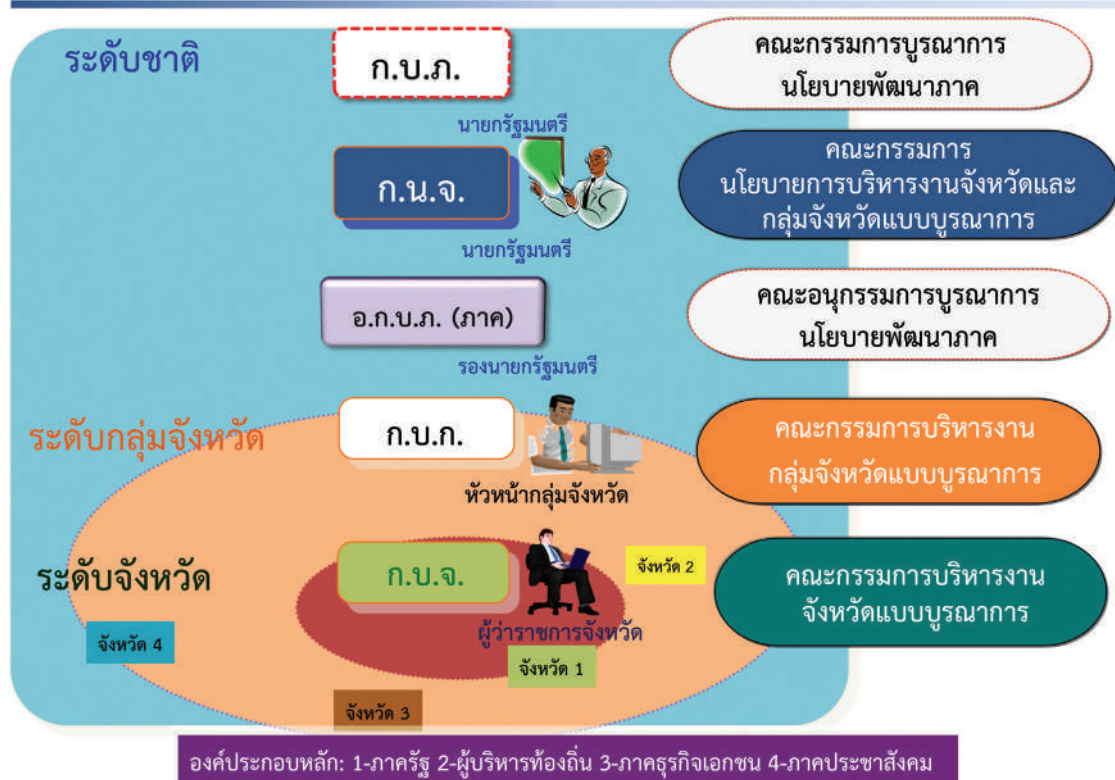
แผนภาพที่ 2 แสดงกลไกการบริหารงานระดับชาติ กลุ่มจังหวัด และจังหวัด