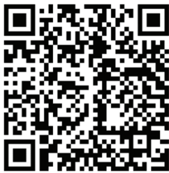
ปฏิทินและแนวทางการเชื่อมโยง และบูรณาการแผนพัฒนา ในระดับพื้นที่ ประจำปีงบประมาณ 2564