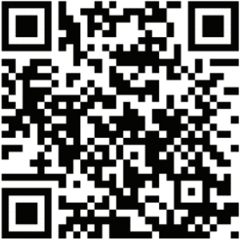
ยุทธศาสตร์ชาติ ระยะ 20 ปี พ.ศ. 2561 - 2580