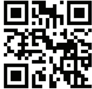
แผนพัฒนาอำเภอ